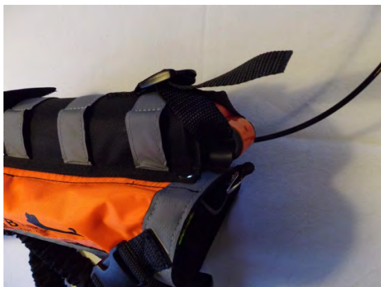
5. Fäst låsremmen.