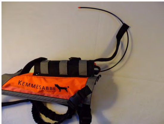
3. Lämna en stump av halsbandet synlig.