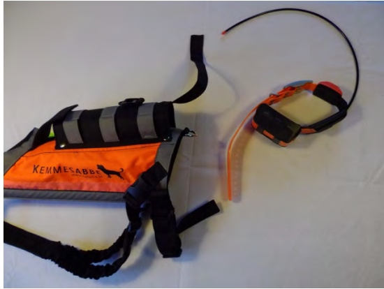
1. Stäng halsbandet kort.