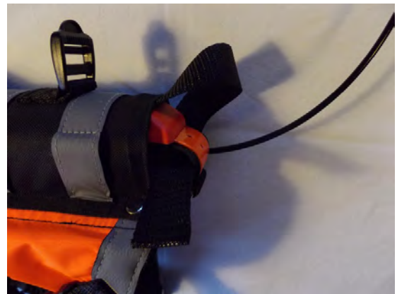
4. Säkra halsbandet med låsremmen